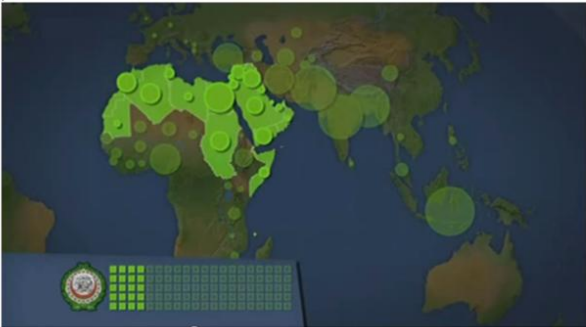
Fig. 5 – Répartition de l'Islam dans le monde

Au sein de chaque pays du monde arabe, les modes de vie sont également très variés. Le fossé qui existe entre les régions urbaines et les régions rurales est énorme et se reflète dans la vie quotidienne des populations et leurs moyens de subsistance. En effet, l'urbanisation accélérée qu'ont connue plusieurs pays du monde arabe contraste avec certaines régions reculées où l'accès à l'eau potable ou à l'électricité reste précaire.