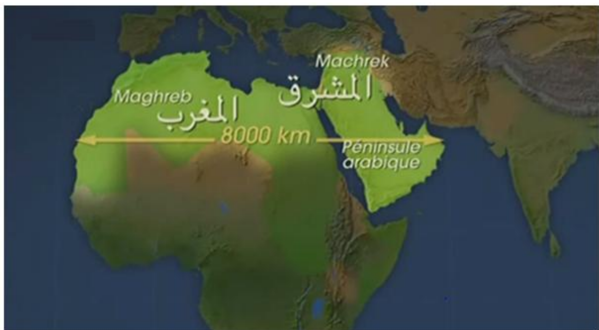
Fig. 1 – Carte du Maghreb, Machrek et Péninsule Arabique

Creusons les différences et les points communs en commençant par délimiter le terrain. Le monde arabe est souvent divisé en 2 ou 3 aires géographiques. Le Maghreb en arabe signifie 'couchant', par opposition au Machrek, à l'est, qui signifie 'levant'. Les pays du golfe persique dans la péninsule arabique se distinguent quant à eux par l'existence d'une majorité de systèmes politiques particuliers : les monarchies pétrolières.