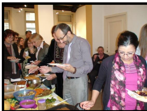
AWSA-Be a fêté la fin de ces cours d'arabe le 19 juin avec au programme repas, danses et musique