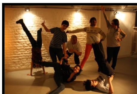
Animations avec les jeunes de l'AMO Le Toucan