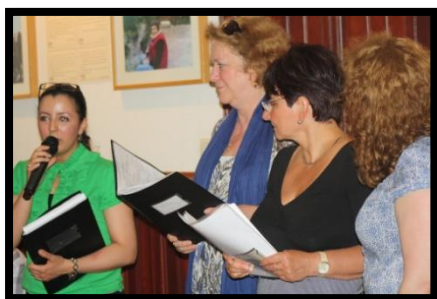
Vernissage Expo Wolu-jeunes, 24/05

Née d'un concours lancé en 2009 par AWSA-Be asbl, l'exposition « Femmes du monde arabe, ici ou ailleurs...regards alternatifs » vise à questionner les stéréotypes existants sur les femmes originaires du monde arabe qui se perpétuent tant dans les communautés arabes elles-mêmes que dans les sociétés d'accueil, et à montrer une autre image de ces femmes en faisant réfléchir le public aux stéréotypes et préjugés auxquels elles sont confrontées. Nous l'avons donc animé et fait visiter à la demande des partenaires et de leur public. Voici plus concrètement les programmes des activités autour de cette exposition :