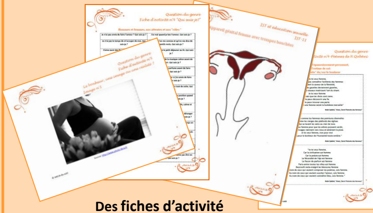
Des fiches d'activité