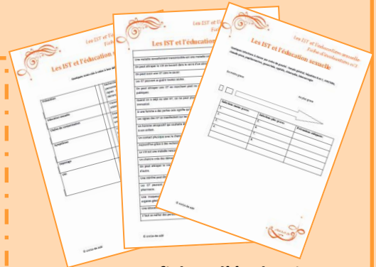
Des fiches d'évaluation