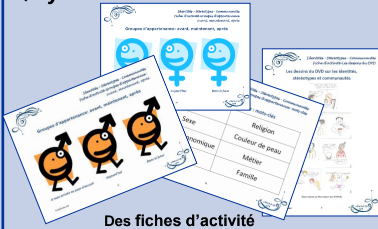
Des fiches d'activité